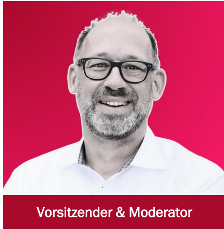
Vorsitzender & Moderator